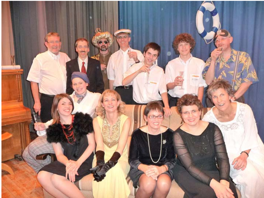
Les acteurs et les actrices de la « Croisière des destinées ».