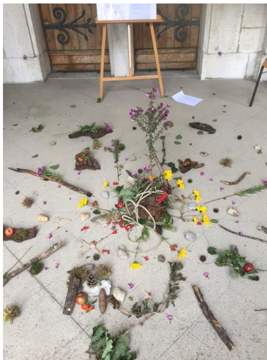
« Landart » réalisé lors de Paroisse en Fête 2020