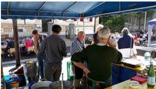
Le cœur de Paroisse en Fête !

La grande fête annuelle de la paroisse a eu lieu les 21 et 22 septembre à la salle St-Louis juste en face du centre paroissial et sur la rue qui a pu à nouveau être bouclée. La soupe et les différents menus préparés avec soin par une magnifique équipe de bénévoles ont réjoui les papilles des visiteurs et visiteuses qui ont encore pu prolonger le plaisir avec les délicieuses pâtisseries préparées avec amour. Le samedi après-midi, une petite inauguration du centre paroissial, presque terminé mais pas encore habité, a eu lieu avec la visite des lieux. Le dimanche a débuté de belle manière avec le culte d'accueil des catéchumènes.