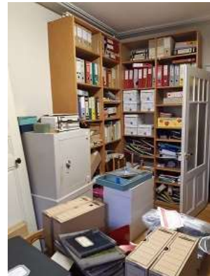
Mise en cartons du secrétariat

Au mois de janvier, suite aux travaux préparatifs du DFBI et du CP, un nouveau poste paroissial a été créé. La structure du poste à 30% comprend la gestion de la conciergerie et l'accompagnement de nos deux dames de ménage (employées dans le cadre du chèque-emploi neuchâtelois, Ticketac). La gestion des locations est le second volet important du poste. Enfin 5 fois par an, la conception avec le comité de rédaction, puis la mise en œuvre de la parution et de l'acheminement du Porte-Parole viennent compléter les tâches inhérentes au poste.