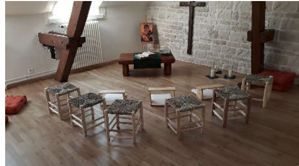
La nouvelle chapelle du centre paroissial

C'est dans un arbre nu, prêt à être fortement taillé et remodelé que l'année a commencé avec les importants travaux de rénovation et l'aménagement d'un ascenseur au Presbytère Farel. Ils ont pu être presque achevés pour Paroisse en Fête en septembre. La campagne de dons pour soutenir un objet ou une pièce du Centre paroissial a bien fonctionné. La chapelle et la cafétéria ont été aménagées ; le Centre œcuménique de documentation (Cod) et le secrétariat paroissial, ainsi que les bureaux des pasteurs ont emménagé début janvier 2020.