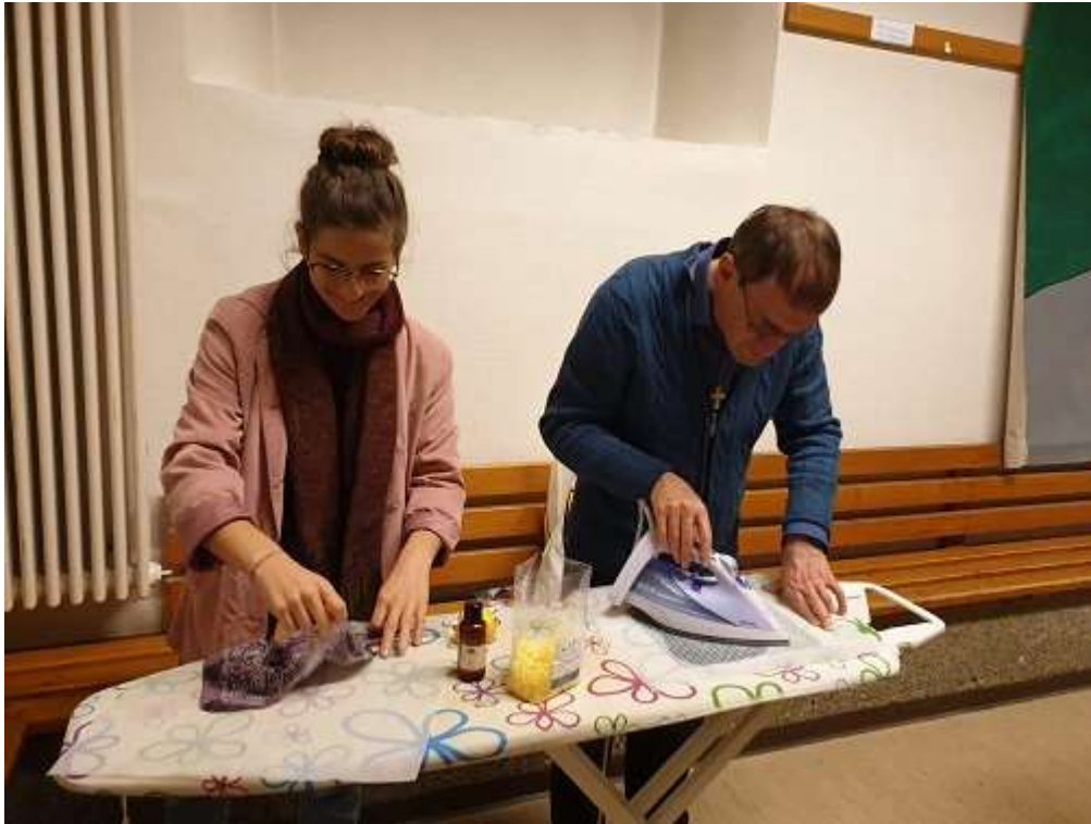
« Montagnes en transition » : confection de Bee's Wrap dans le cadre de la thématique « Zéro déchets »