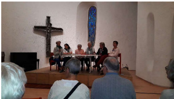
Table ronde « La place des femmes dans l'église »

Dans cette ramure très dense, arrêtons-nous sur quelques jeunes rameaux : un espace de parole a été mis sur pied et a lieu tous les deux mois. La formation Eglise de témoins a débuté en novembre avec un groupe d'une trentaine de personnes engagées à suivre les 6 modules un samedi matin par mois. Des premiers fruits savoureux apparaîtront au printemps 2020. De nombreuses et riches activités ont eu lieu dans la nouvelle chapelle et la cafétéria du Centre paroissial.