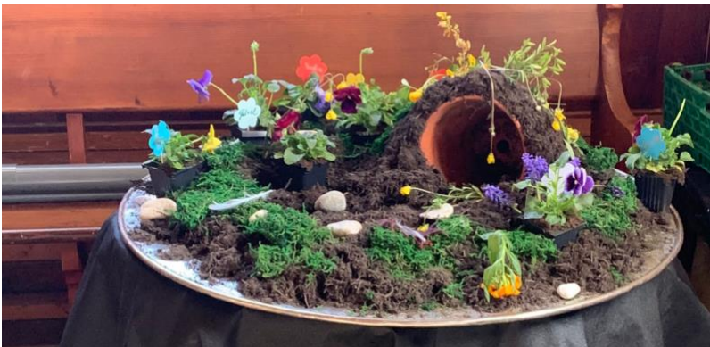
Tombeau vide, culte de Pâques 2022, Cortailod