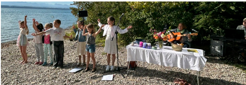
Culte à la Pointe du Grain.