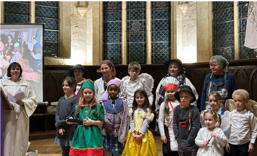
La pastorale des Santons à St-Aubin.