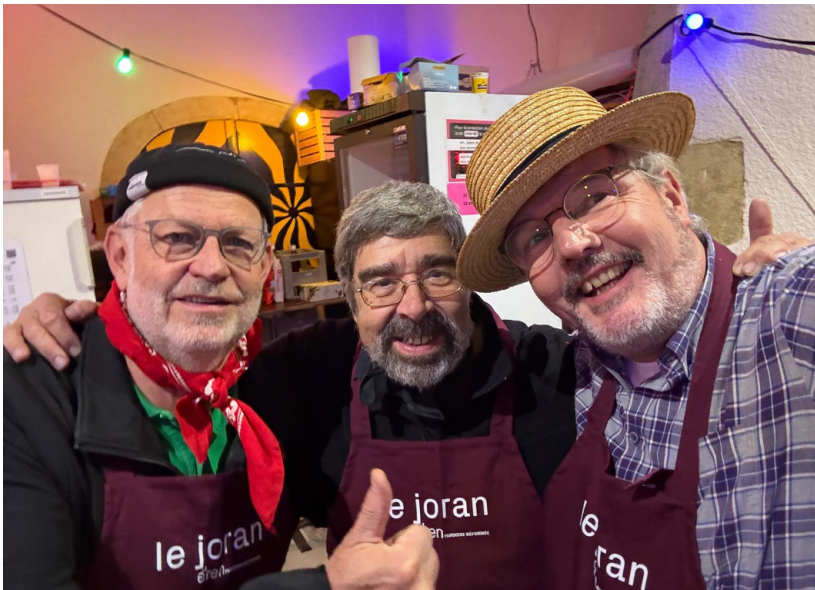
À la fête de la Vendange de Cortailod.