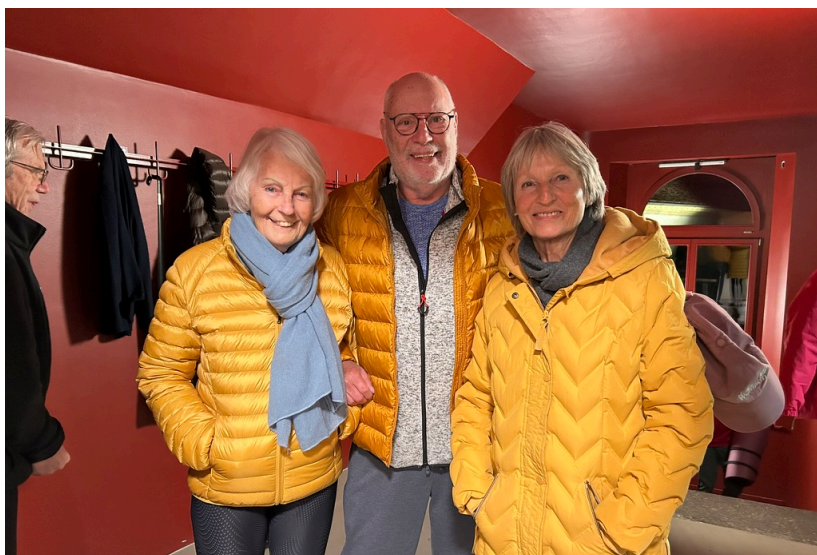
Dans les coulisses.