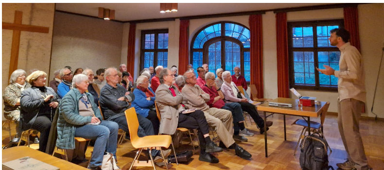
Conférence d'Antoine Vuille, philosophe.