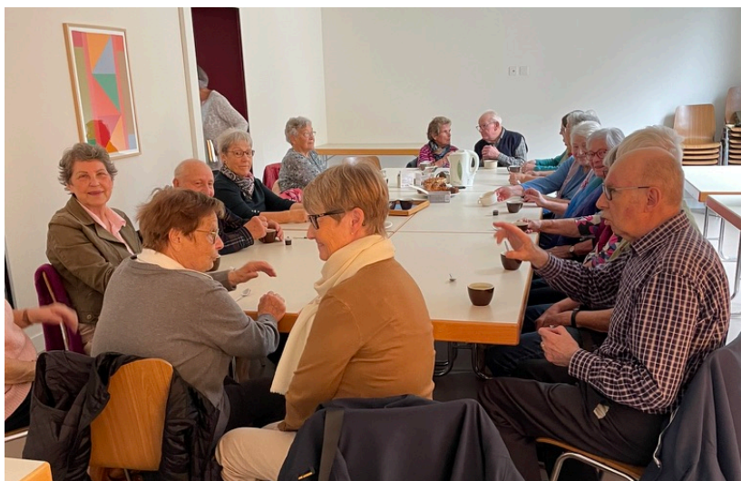
Le café Béroche.