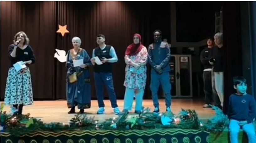
Fête de Noël à Boudry.