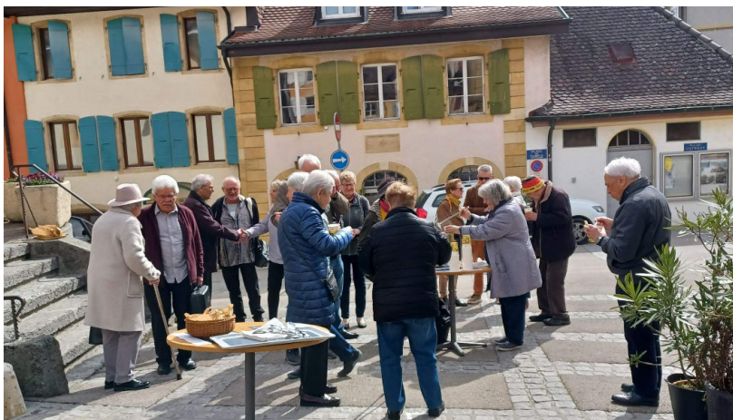
Soupe de carême à Cortailod.

La campagne de carême, du 5 mars au 19 avril, s'est déroulée avec les manifestations habituelles : cultes, soupes, jeûne et vente de roses.