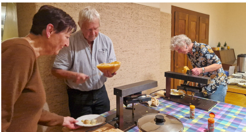
Souper raclette à Bevaix.