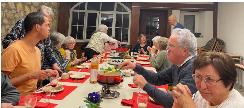
Repas des bénévoles à Boudry.