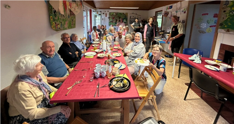
Souper des bénévoles à Pontareuse.