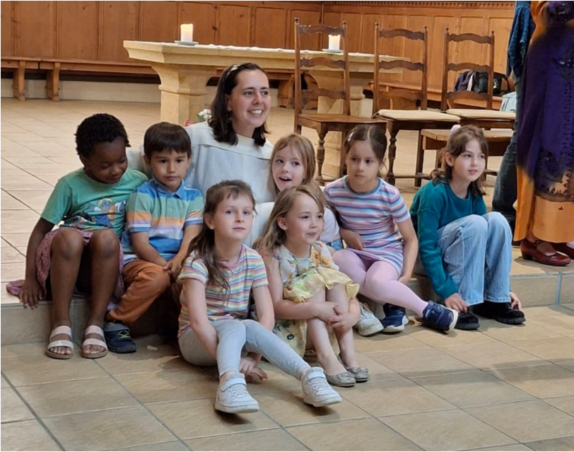
Fête des familles à Boudry.