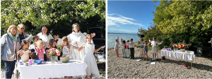
Culte de rentrée à la Pointe du Grain, le 31 août.